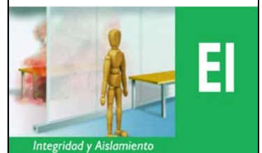
Integridad y Aislamiento

El sistema VF-GLASS-F EI-120 , está formado por una serie de perfiles laminados de acero galvanizado de alta resistencia, S275 JR+M EN-10025-2/2004, aislado térmicamente a ambos lados mediante placas de fibrosilicato cálcico endotérmico a lo largo del perfil, con diferente grosor en función de la clasificación de resistencia al fuego requerida y con tapetas embellecedoras de 70mm. construidas en acero DX51D Z275, lacado en color según carta RAL ó en acero inoxidable AISI 304/316.