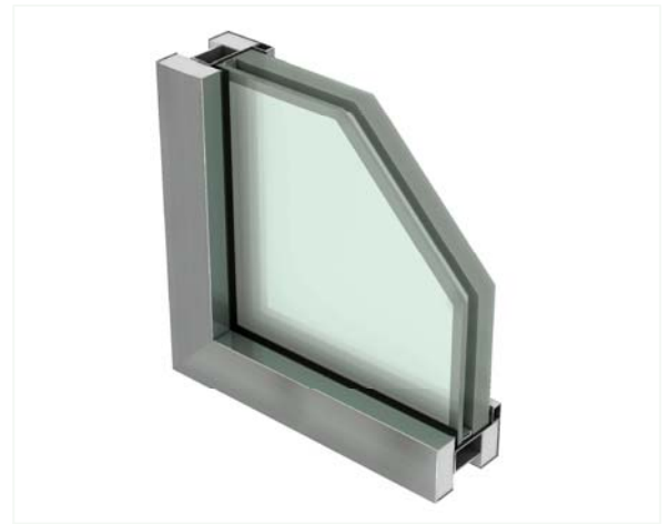
Infografía fijo doble acristalamiento.